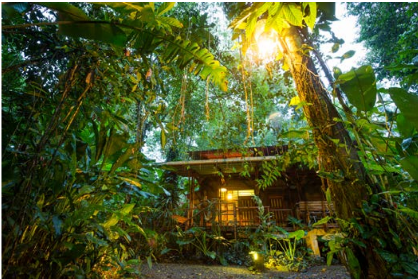
Eco-lodge nella foresta pluviale