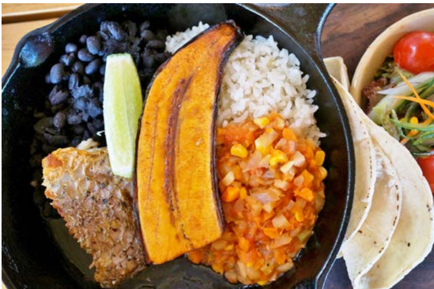
Cibo tipico della Costa Rica

Guarda il mio video” Viaggio in Costa Rica: a tavola!” >>