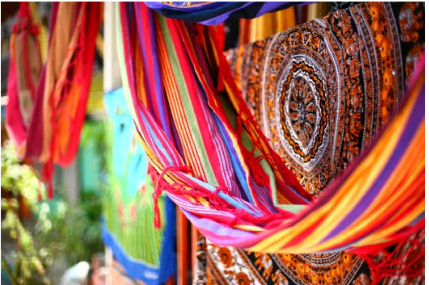
Prodotti tipici dei mercati in Costa Rica