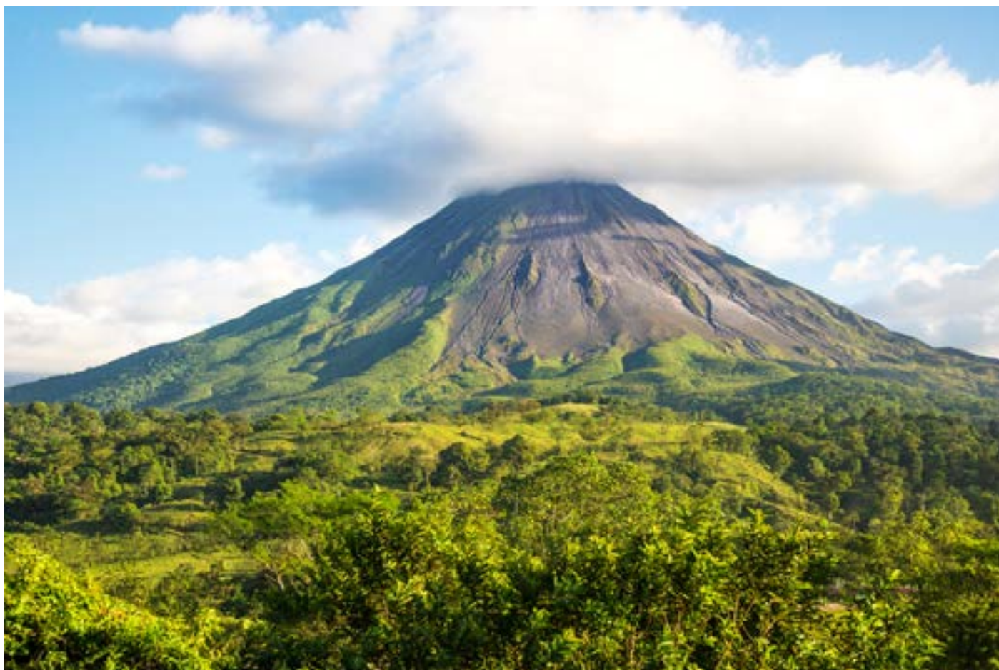
Arenal, Costa Rica

E per finire goditi questo splendido tramonto sulla Playa Carrillo>> Clicca qui