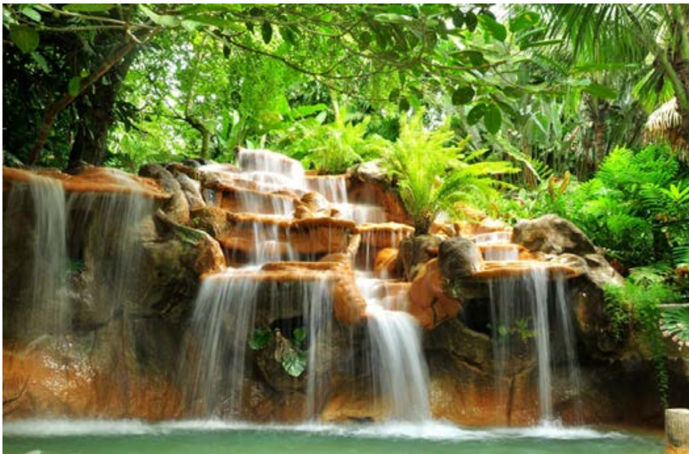
Cascate in Costa Rica

Guarda il mio video di presentazione della Costa Rica >> Clicca qui