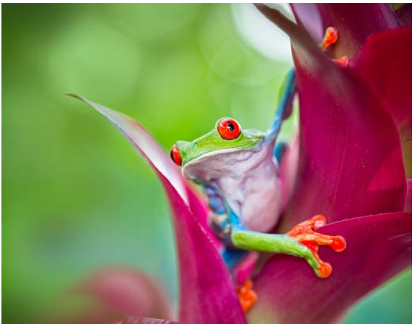
Rana dagli occhi rossi, Costa Rica

Guarda il mio video: “Il Parco nazionale Corcovado” >> Clicca qui