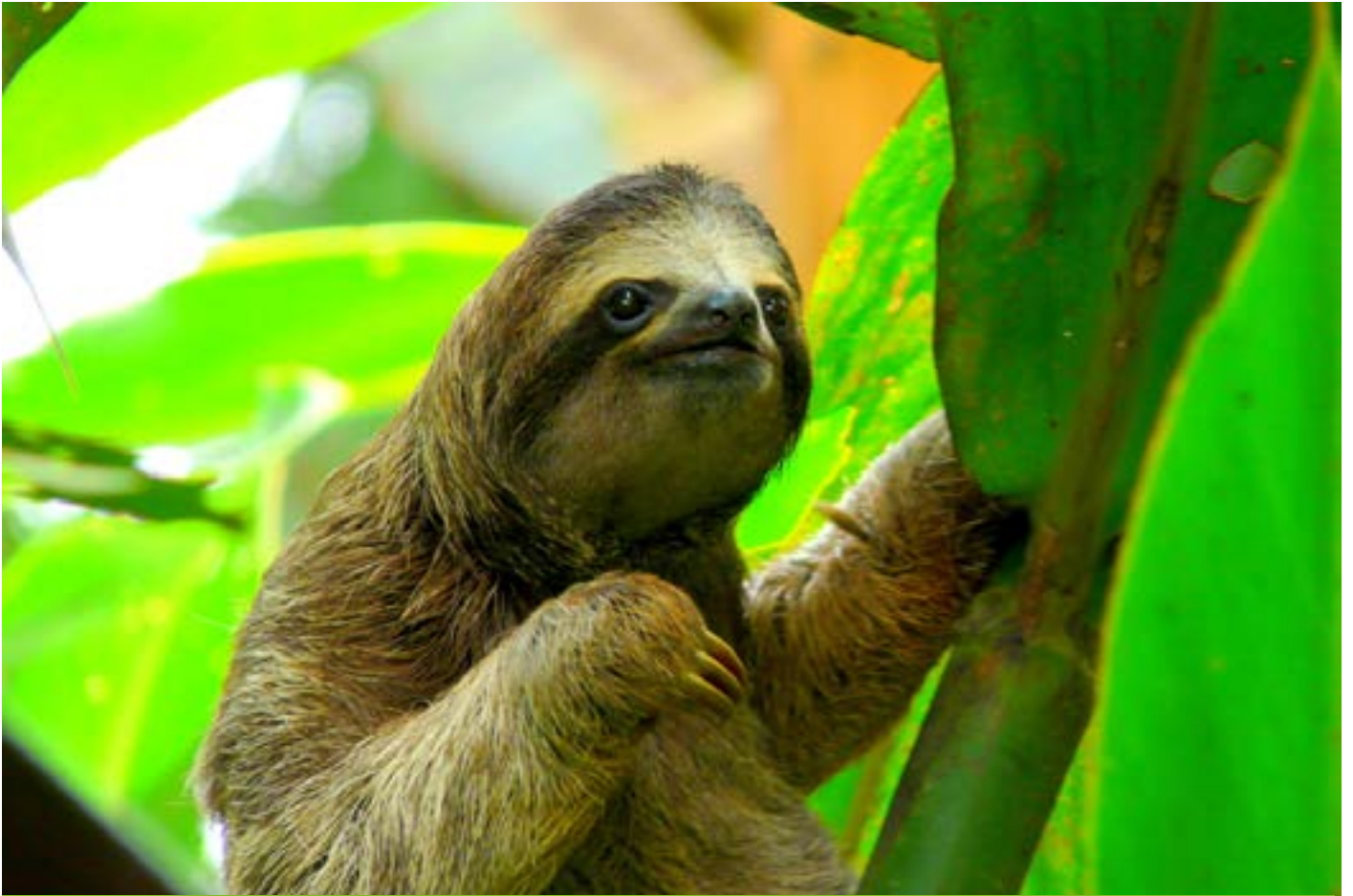
Bradipo, Costa Rica

Guarda il mio video: “Il Rifugio Nazionale Gandoca-Manzanillo” >> Clicca qui