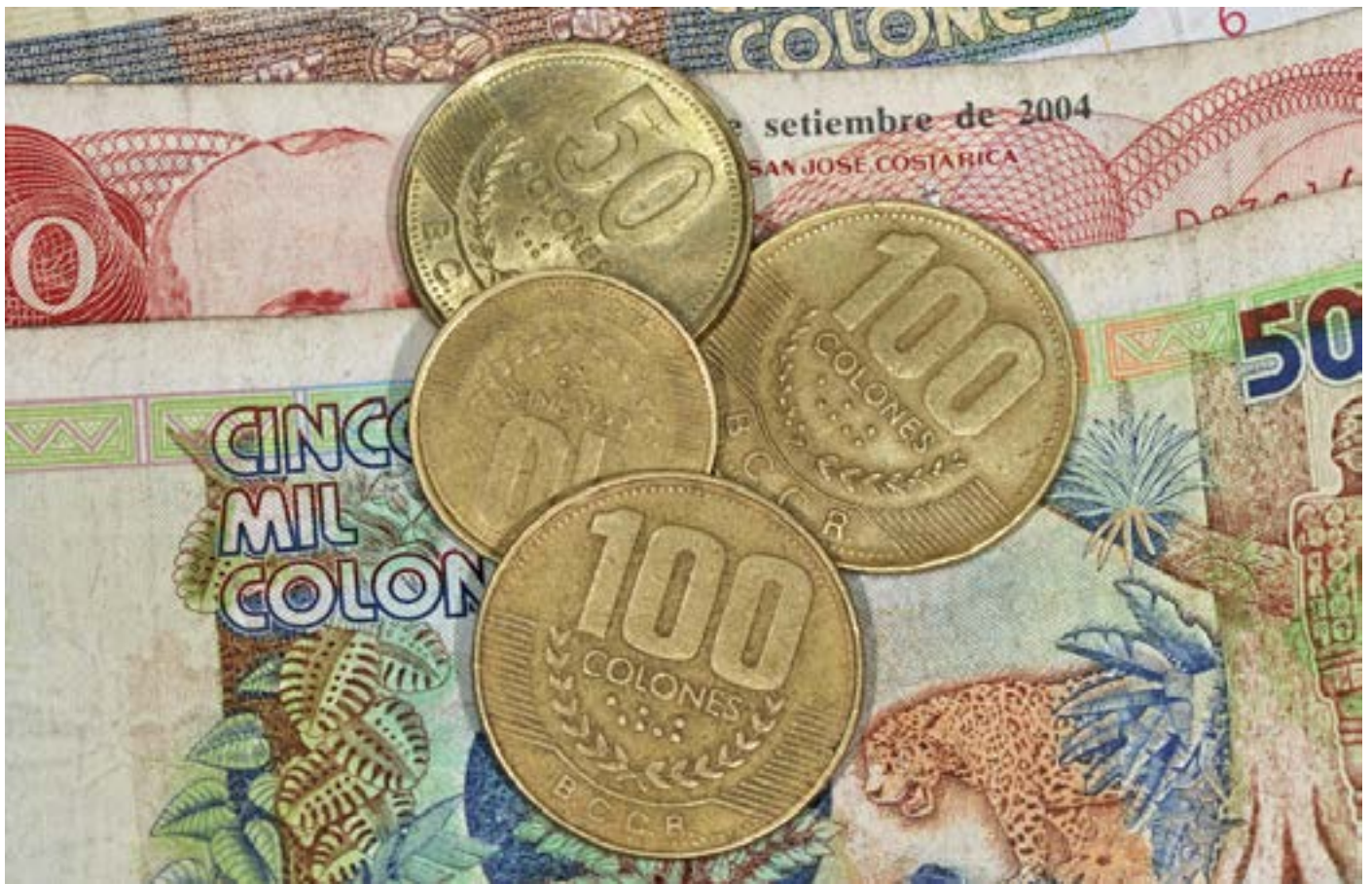
Colón, moneta della Costa Rica