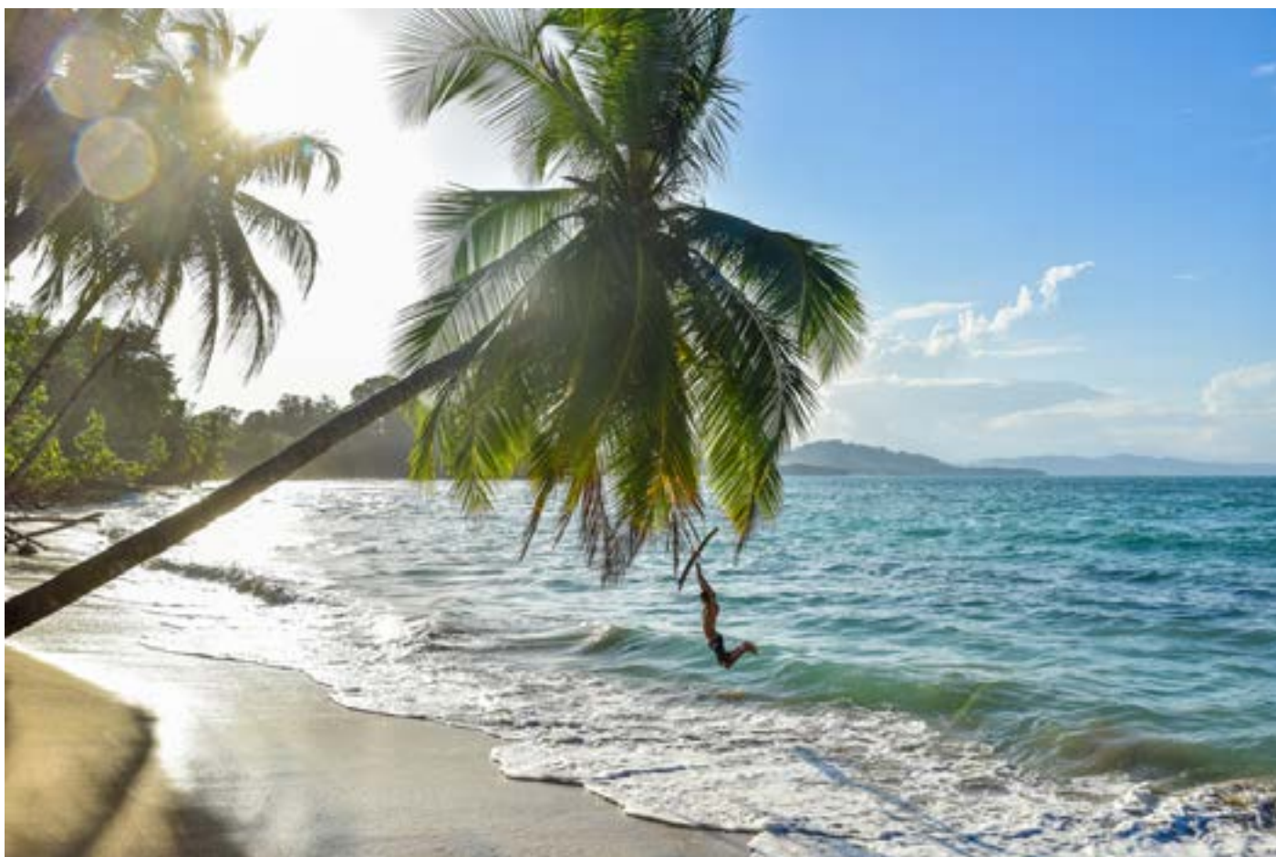
Punta Uva beach, Costa Rica