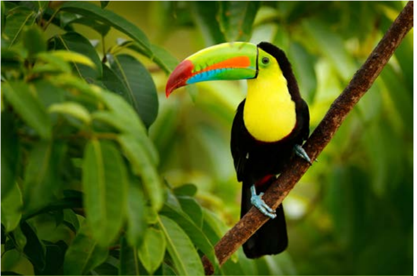
Tucano, Costa Rica

Guarda il mio video: “Viaggio in Costa Rica: scopri i Parchi” >> Clicca qui